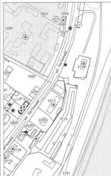
0314 - numărul terenului